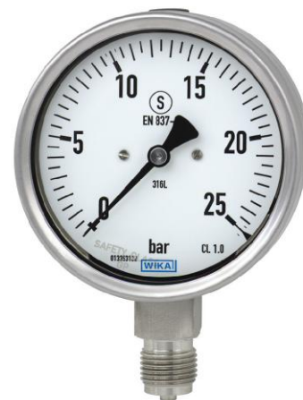
232.30, 233.30, 262.30, 263.30