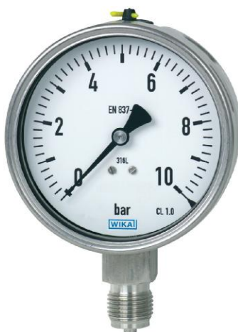
232.50, 233.50, 262.50, 263.50