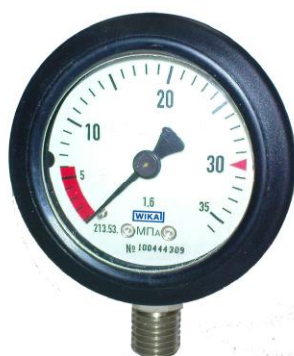
213.53 в исполнении для пожарных аппаратов