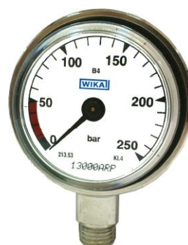
213.53 в исполнении для водолазных аппаратов