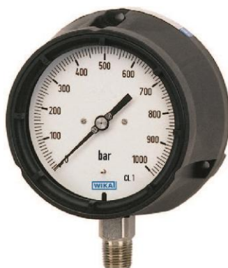
232.34, 233.34, 212.34, 213.34, 262.34, 263.34