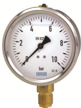
213.53 в стандартном исполнении